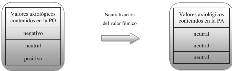
Gráfico 2: La neutralización del valor fílmico

Ahora bien, para poder elaborar una película audiodescrita comunicativamente equivalente a la película original no se debería utilizar únicamente lexemas con un valor axiológico neutral, ya que de este modo se neutralizaría el valor fílmico como podemos observar en estos gráficos (2).