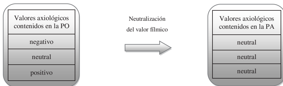
Gráfico 3: La transmisión neutral del valor fílmico

comunicativamente equivalente y en cuya audiodescripción se refleja adecuadamente el valor fílmico de la PO como podemos ver en los siguientes gráficos (3).