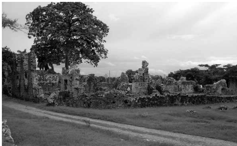
Figura 3. Vista de las ruinas de la iglesia de Santo Domingo, Panamá Viejo. Fotografía: Clemente Marín Valdez, 2014.

La principal característica geográfica del territorio que fuera elegido por Pedrarias para la fundación del emplazamiento, era a la vez uno de los más grandes valores y la fuente de importantes problemas. La que incluso habría de convertirse en capital de Castilla del Oro (1520-1540) estaba rodeada por dos ríos, diversos riachuelos y cursos de agua interconectados, se encontraba a orillas del océano y al costado de una ensenada.