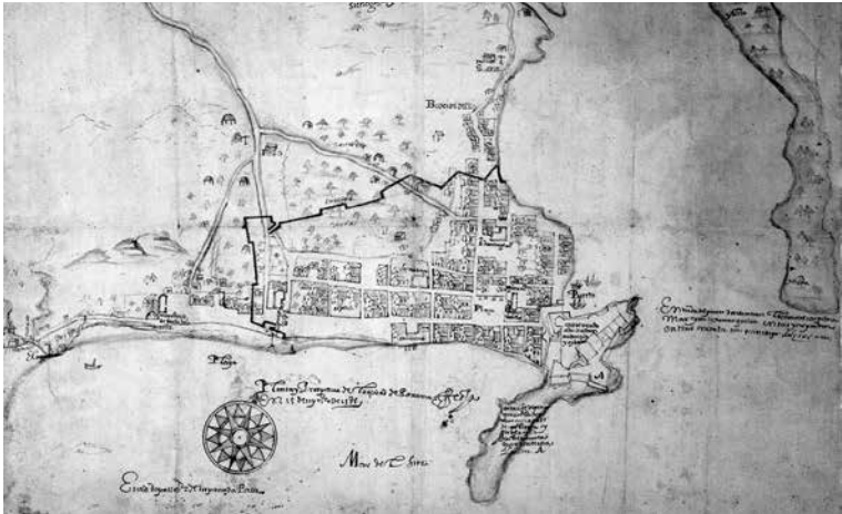
Figura 2. La Ciudad de Panamá en 1609, según el trazado del Ingeniero Real Cristóbal de Roda.