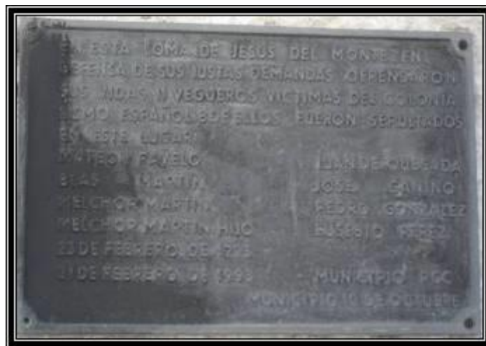
Placa recordatoria de los vegueros enterrados en el cementerio de la iglesia de Jesús del Monte, único tributo que existió en el lugar que perpetuaba la memoria del hecho (Fue sustraída de forma anónima en el año 2013)

No obstante, la Corona tampoco podía permitirse no intervenir ante un desafío planteado por unos súbditos que se negaban a acatar las órdenes procedentes de la metrópoli. Con el objetivo de mantener el equilibrio, se trató de demostrar autoridad y, como telón de fondo, asegurar que el proceso reformista siguiera su curso. Así podemos comprender un poco mejor las decisiones tomadas por la Corona durante el desarrollo de este conflicto.