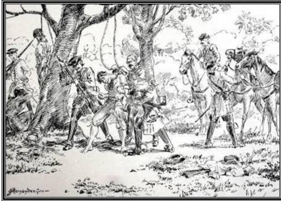
Imagen que representa el momento en el que los vegueros apresados son ejecutados por las tropas de la Corona

entre ambas partes, como por ejemplo la quema de cosechas o la respuesta, que podríamos calificar de desproporcionada, por parte de las tropas reales durante el tercer levantamiento.