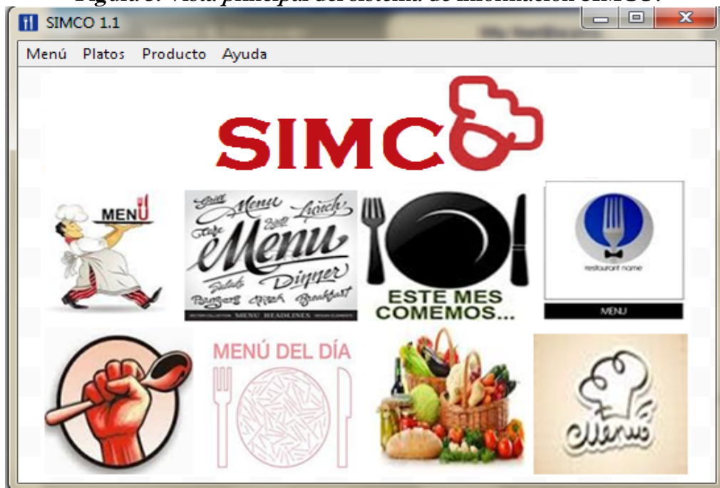
Figura 3: Vista principal del sistema de información SIMCO.

Uno de los resultados más relevantes que se obtienen con la implementación del software es la integración de la herramienta LPT-SQL con el sistema de información. Esta herramienta está concebida para trabajar con un conjunto de categorías de reglas desde la perspectiva de datos; estas se caracterizan porque ante una operación sobre la base de datos, inserción, actualización o eliminación se chequea que los datos del negocio almacenados cumplen con las reglas que los involucran, esto contribuye a minimizar los errores cuando se trabaja con datos en el sistema así como el tiempo de implementación de la regla a través de los diferentes recursos de base de datos.