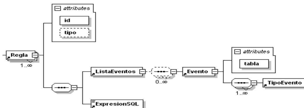
Figura 2: Parte del esquema XSD del repositorio de generación.

Como se puede observar, el repositorio de generación está formado igualmente por varias reglas que son identificadas por su id y tipo. Las reglas almacenadas en este repositorio son un subconjunto de las reglas que contiene el repositorio de reglas.