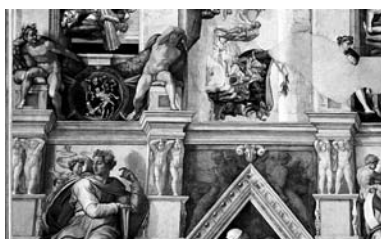
Miguel Angel Bounarroti. Capilla Sixtina, Roma.