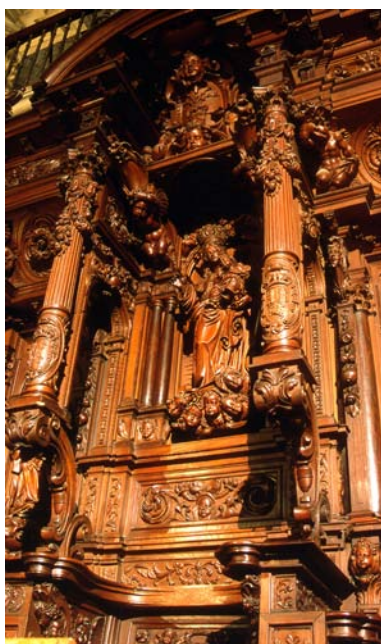
Luis Ortiz de Vargas. Silla prelacial (1635). Coro, Catedral de Málaga.

en otoño había concertado con la Catedral de Málaga la construcción de la sillería del coro 10 .