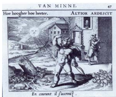
Hoof. Emblemata amatoria (1611).