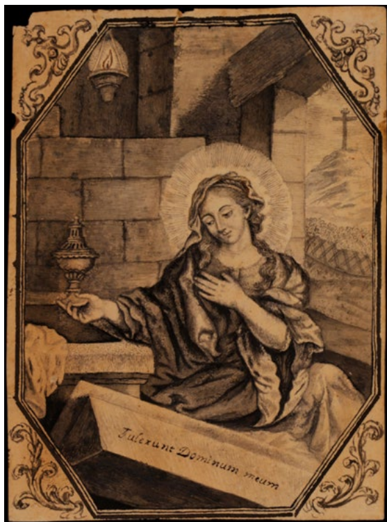
Figura 2. Francisca de Zevallos, María Magdalena ante el sepulcro de Cristo , 1771. Lápiz negro, tinta y aguada gris sobre papel verjurado, 13,4 x 9,9 cm. Disponible en Museo de la Real Academia de Bellas Arte de San Fernando, https://www.academiacolecciones.com/dibujos/inventario.php?id=P-2314