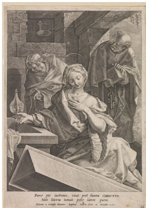
Figura 4. Rafael Sadeler, María Magdalena y los apóstoles Pedro y Juan el evangelista en la tumba vacía de Cristo , 1591. Grabado, 21,1 x 15 cm.